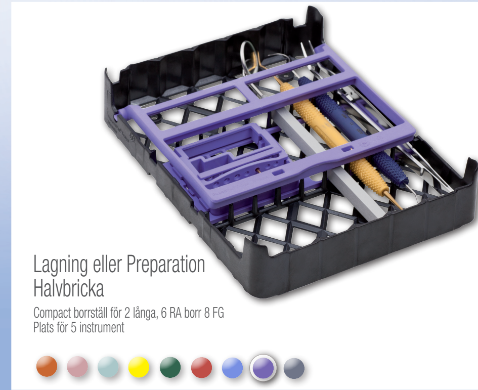
Lagning eller Preparation Halvbricka Compact borrställ för 2 långa, 6 RA borr 8 FG Plats för 5 instrument