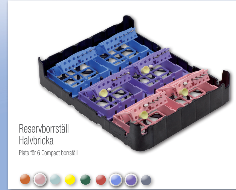
Reservborrställ Halvbricka Plats för 6 Compact borrställ