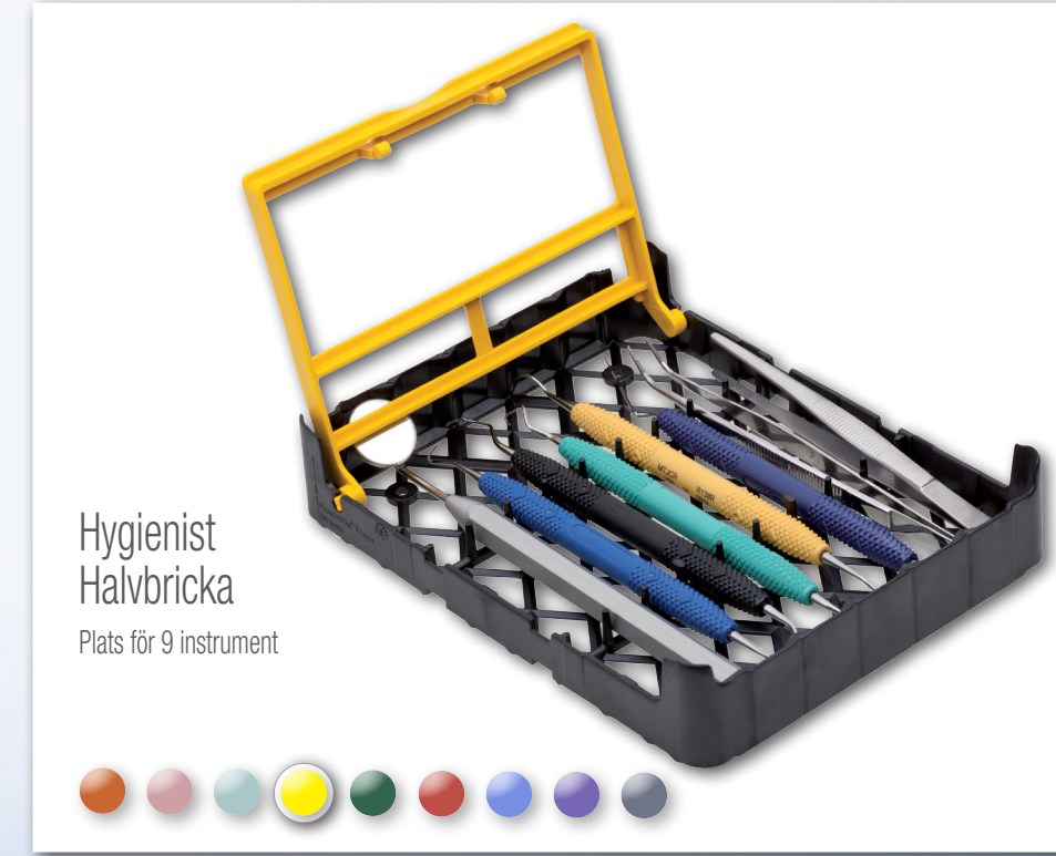
Hygienist Halvbricka Plats för 9 instrument