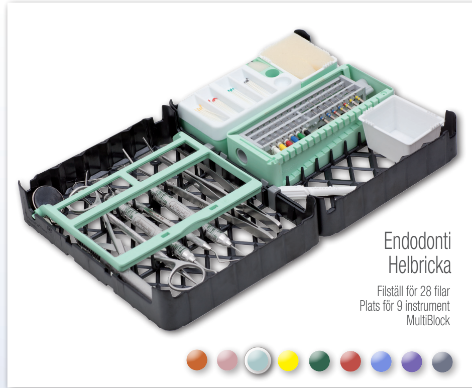
Endodonti Helbricka Filställ för 28 filar Plats för 9 instrument MultiBlock