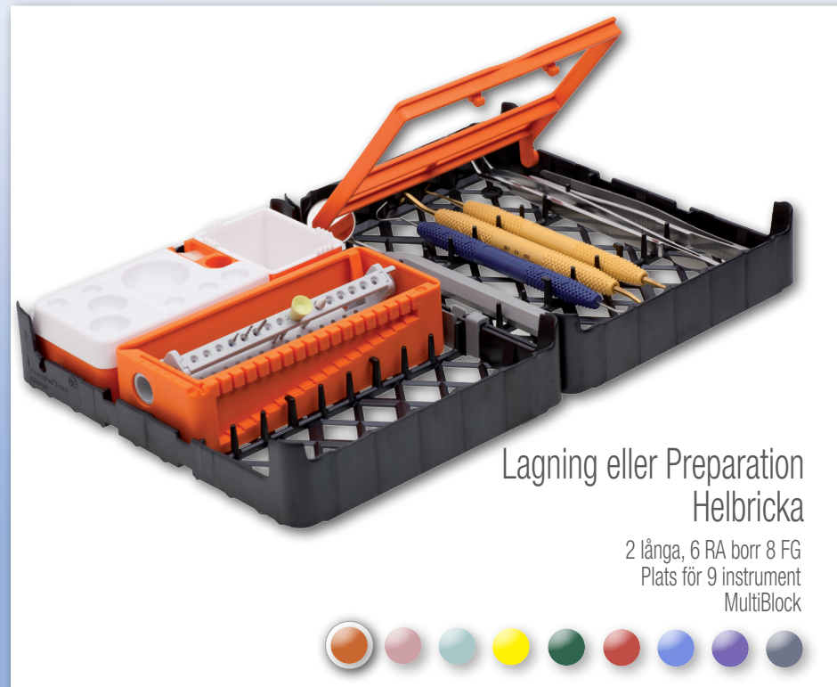
Lagning eller Preparation Helbricka 2 långa, 6 RA borr 8 FG Plats för 9 instrument MultiBlock