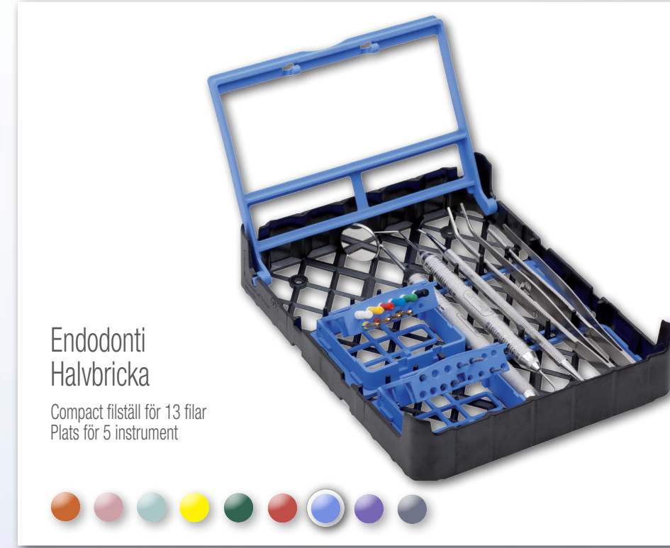
Endodonti Halvbricka Compact filställ för 13 filar Plats för 5 instrument