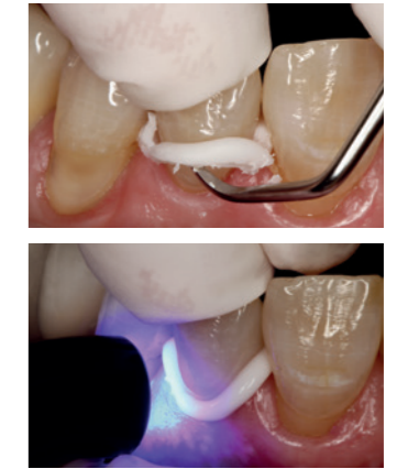
Quick and easy clean-up in the gel phase