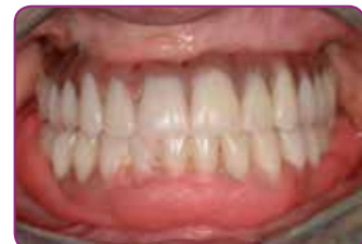
Placera protesen i patientens mun och muskeltrimma. Låt sitta kvar i 5 min.